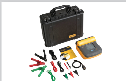
Fluke 1550C Kit per tester per la misura della resistenza d'isolamento