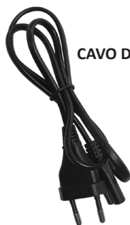
CAVO DI RETE