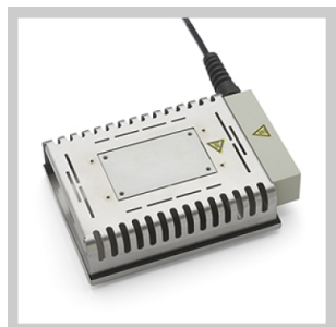
Piastre di preriscaldamento